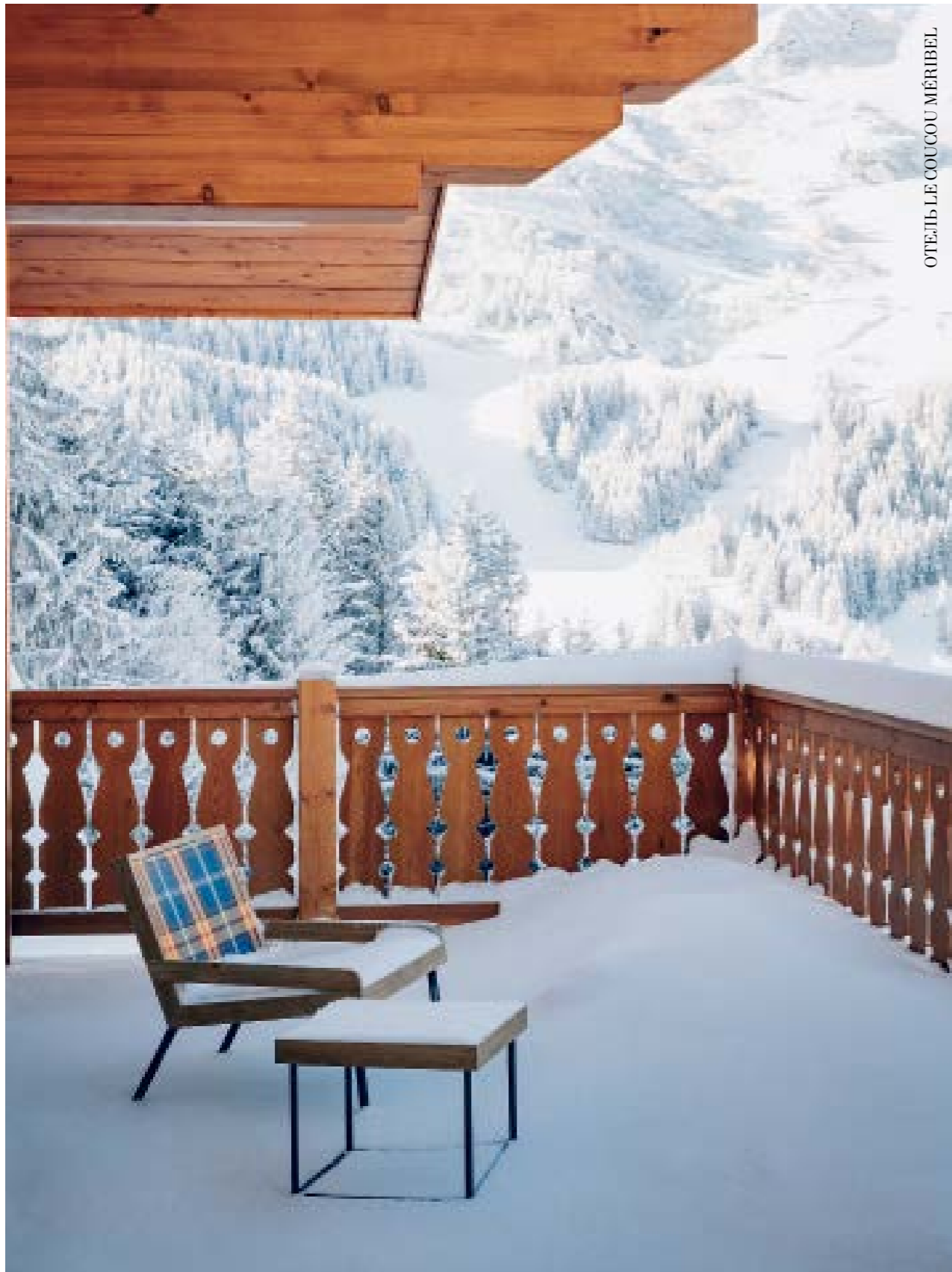
ОТЕЛЬ LE COUSSOU MÉRIBEL