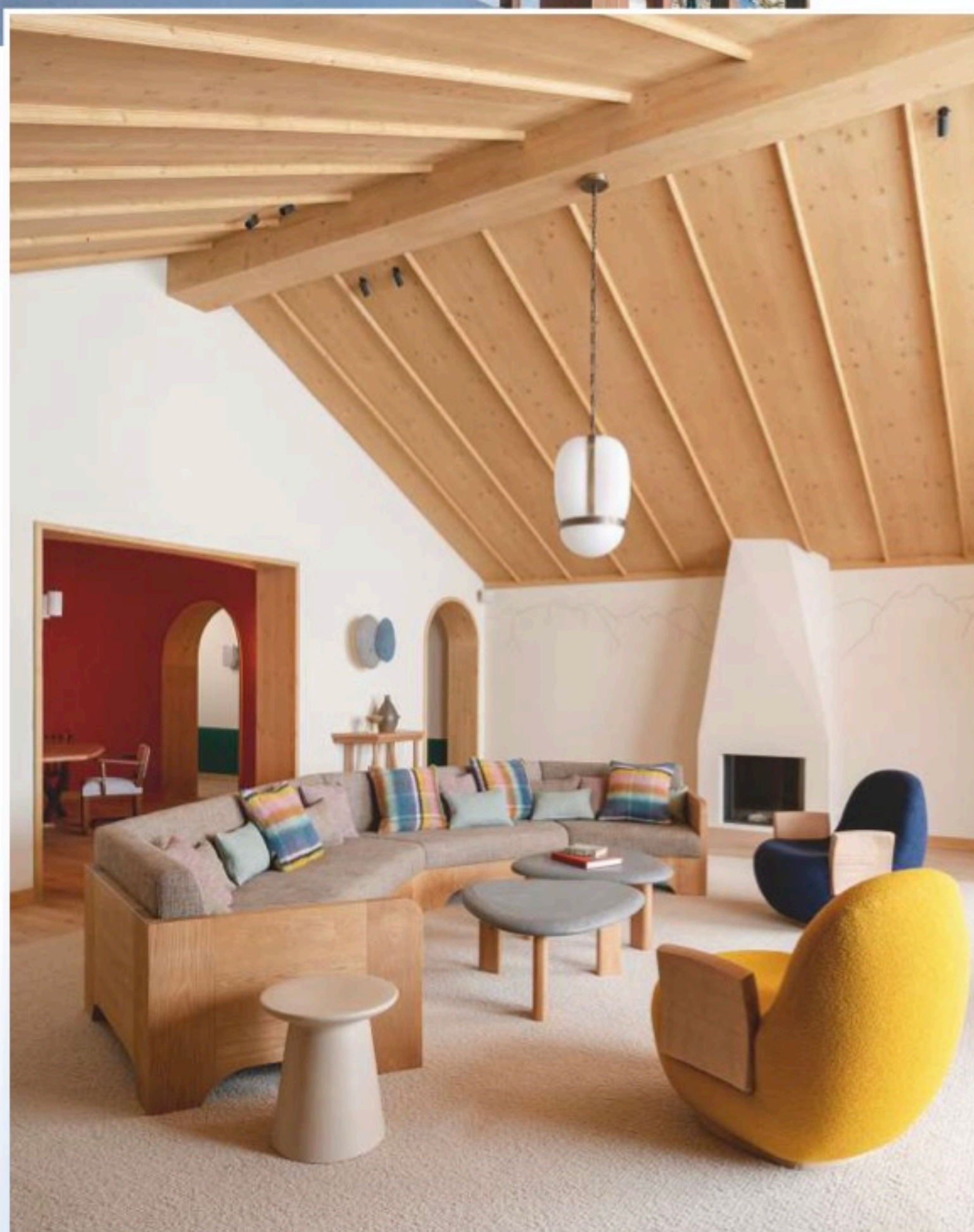
Jérôme Galland ; Vincent Leroux

● Pour 8 personnes, à partir de 6 500 € la nuit, petit-déjeuner compris. Réservations sur lecoucoumeribel.com/fr/chalets