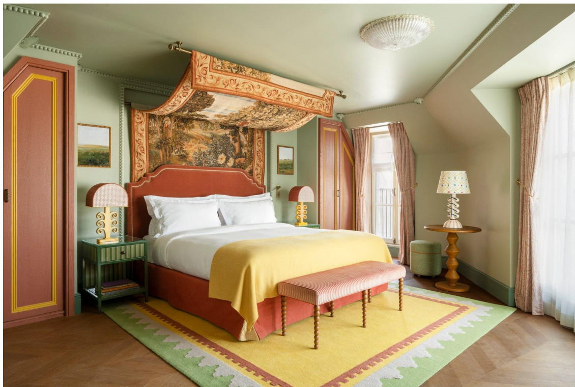
Une chambre du Grand Mazarin à Paris, dont le décor est signé Martin Brudnizki.