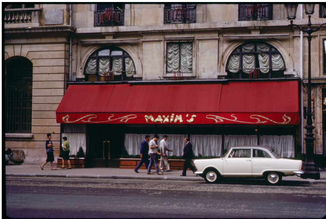
La façade du restaurant Maxim's, rue Royale, en 1963.