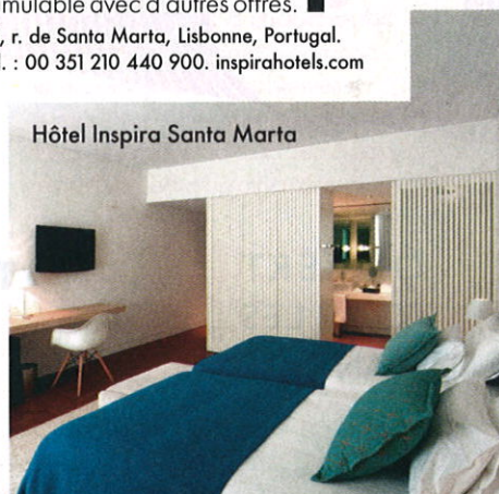
Hôtel Inspira Santa Marta

L'offre lectrices. - 15 % de réduction pour toute réservation de 2 nuits et - 20 % pour 3 nuits avec le code INSPIRAELLE sur le mail reservas.ismh@inspirahotels.com Valable jusqu'au 27 décembre 2019 sur les chambres supérieure, deluxe et famille (sous réserve de disponibilité) et non cumulable avec d'autres offres. ■ 48, r. de Santa Marta, Lisbonne, Portugal. Tél. : 00 351 210 440 900. inspirahotels.com