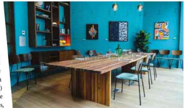
Espace de réunion au Nida