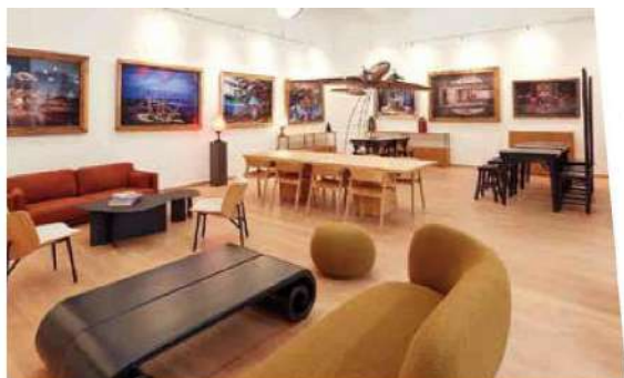
La Maison du Voyage