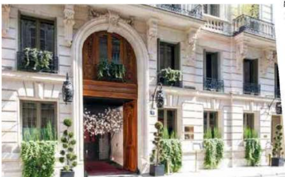
La Maison Delano