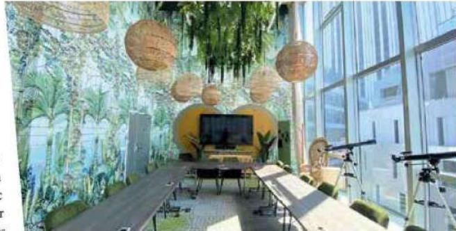
Le Wojo Montparnasse