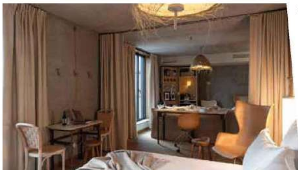
Chaude ambiance au Mob House

chambres), qui compte un Club de 300 m 2 avec terrasse composé de divers salons, un espace forme (salle de fitness, sauna et salle de yoga) et 2 salles de séminaire dont une modulable de 73 m 2 , avec accès direct à une terrasse commune et au restaurant Noccio (110 couverts). Enfin, au cœur même des Puces de Saint-Ouen et à une centaine de mètres à peine du Mob Hotel, le Mob House (100 chambres) a ouvert ses portes en janvier 2022. Deuxième opus de la saga initiée par Cyril Aouizerate, Michel Reybier et Philippe Starck, cette nouvelle adresse aligne une brasserie locale et bio de 200 couverts, un jardin planté de plus de 2000 m 2 , une piscine extérieure de 20 m, une salle de sport, une salle de conversation et une grande table d'hôte. L'ensemble, placé sous le principe directeur de l'écologie sociale depuis la construction du bâtiment jusqu'au mobilier accordant la priorité aux matériaux naturels.