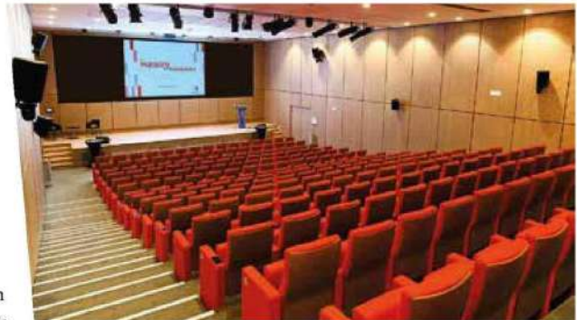
À la Maison du Handball

Au 2 e semestre 2022, l'offre hôtelière et résidentielle de Paris La Défense affichait dans son périmètre historique 3 900 chambres incluant 800 chambres ouvertes au 1 er semestre 2022 et, en péri-Défense, 7 800 chambres. Parmi les dernières ouvertures, citons le Mama Shelter Paris La Défense (211 chambres) dont le rooftop domine le bois de Boulogne et Paris, le Tribe Paris La Défense Esplanade 4* (184 chambres), enseigne australienne à l'ambiance chaleureuse et au design fort, le Stay City Paris La Défense (215 appartements), sis dans un ancien immeuble de bureaux reconverti, ou encore, l' Okko Hotel La Défense 4* (184