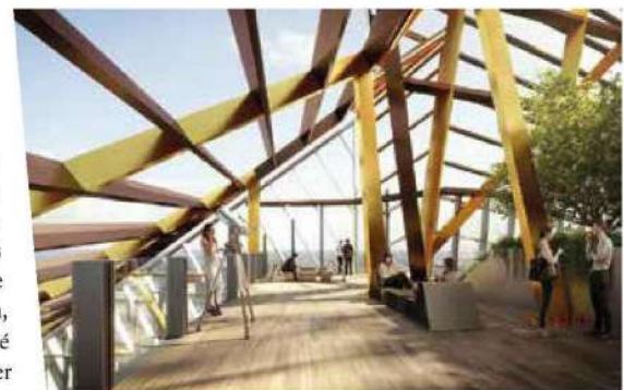
Sur le rooftop de la tour Hekla