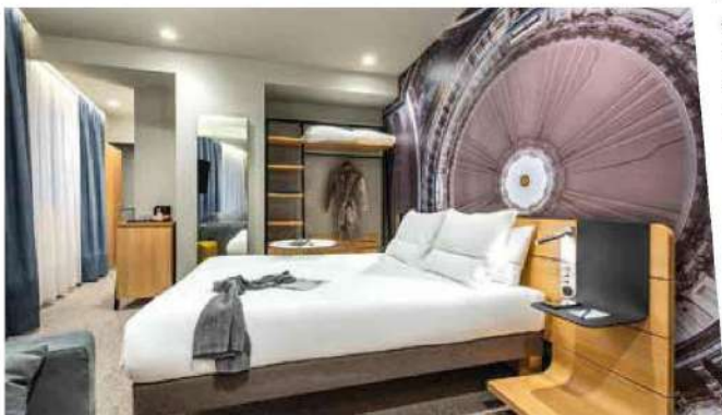
Au Novotel Belleville

renom et stars montantes de la street food, et des pôles loisirs sur 21 000 m 2 (cinéma, scène musicale, bowling, 2 labyrinthes pour des séances de laser game avec courses spatiales et combats d'extra-terrestres, trampoline park, etc.) dont le plus grand théâtre immersif d'Europe (Batman Gotham City Adventures), sans oublier 200 m 2 de salons modulables destinés aux séminaires (80 à 120 personnes), directement connectés au food market et à la scène événementielle.