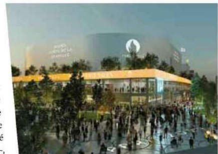
Arena Porte de La Chapelle