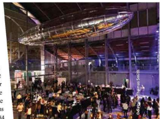
Avant-première au Hangar Y