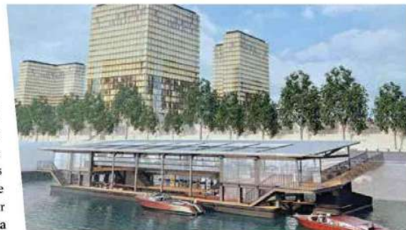
Le futur Quai de la Photo