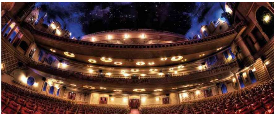
Le Grand Rex