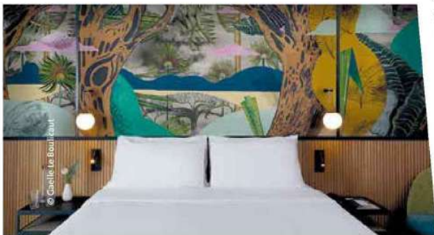
Ambiance au Drawing House