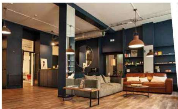
La Maison Hapsatousy