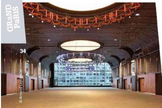
La ballroom du Pullmann Montparnasse