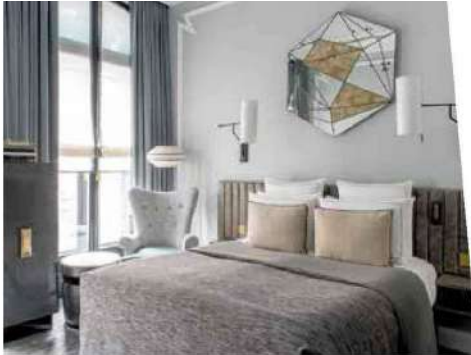
Au Nolinski Paris

(48 chambres, bar et terrasse en rooftop), adresse du quartier de Grenelle totalement réhabilitée par le groupe Orso qui a également ouvert Orphée (44 chambres), entre le jardin des Plantes et le quartier Saint-Marcel, le Mercedes (37 chambres), icône de l'Art déco du quartier Wagram ou encore, non loin de l'avenue Foch, le Belgrand Hôtel Paris Champs-Élysées 4* (46 chambres), première adresse Tapestry Collection by Hilton à Paris, pour une plongée dans les arts du Paris de la Belle Époque jusqu'à aujourd'hui, restaurant, bar, patio extérieur et terrasse en prime.