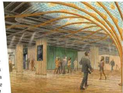
CNIT Hall Amazonie