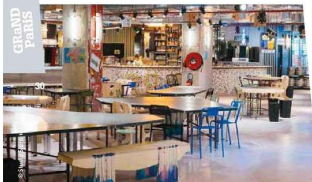
Food Society Paris Gaité