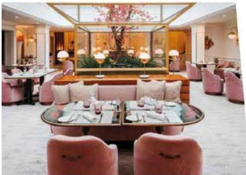
Le restaurant poudré de l'Hôtel Scribe