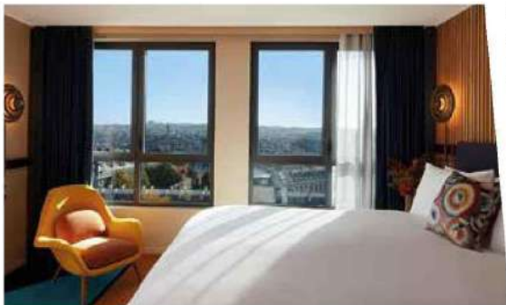
Une chambre du SO Paris