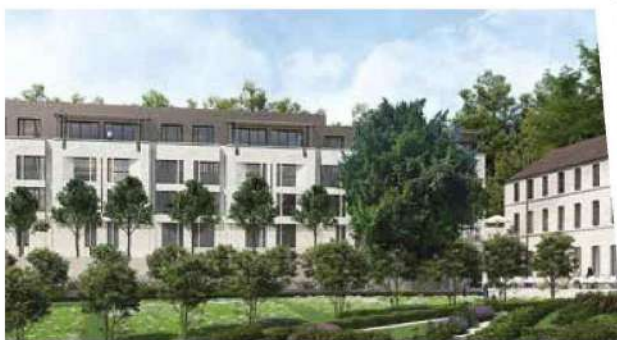
Domaine Reine Margot

Attendu pour ce premier trimestre, le Domaine Reine Margot à Issy-les-Moulineaux. Bordé par le parc Saint-Jean Paul II et l'Hôpital Suisse, au cœur de l'ancien foyer de retraite des prêtres de Saint-Sulpice, cet ancien domaine royal en cours de restauration va se convertir en un hôtel 5* sous enseigne MGallery (groupe Accor). Signé par l'agence Wilmotte & Associés Architectes, ce projet audacieux comptera 11 chambres et un restaurant gastronomique piloté par le chef Christian Constant, tandis qu'un nouveau bâtiment se consacrera à l'hébergement pour un total de 83 chambres. Puis, Colombes a été choisie par Hilton Double Tree pour un établissement 4* de 148 chambres dont la livraison est prévue en 2024 tandis que Moxy Hotels , la marque lifestyle de Marriott, devrait s'implanter à Val d'Europe, tout près du parc Disneyland Paris avec une nouvelle adresse francilienne de 238 chambres.