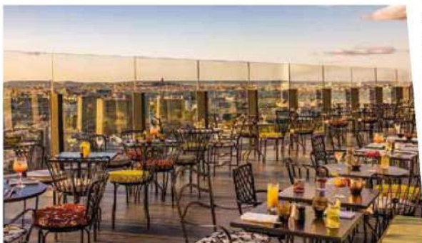
La terrasse du TOO Hotel