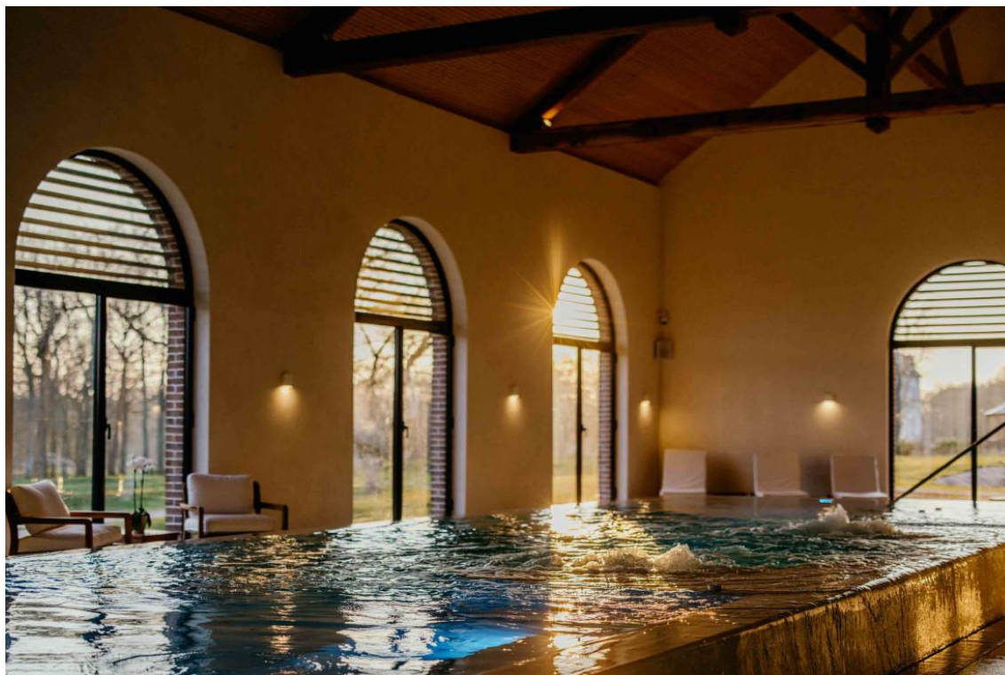
Domaine du Roncemey