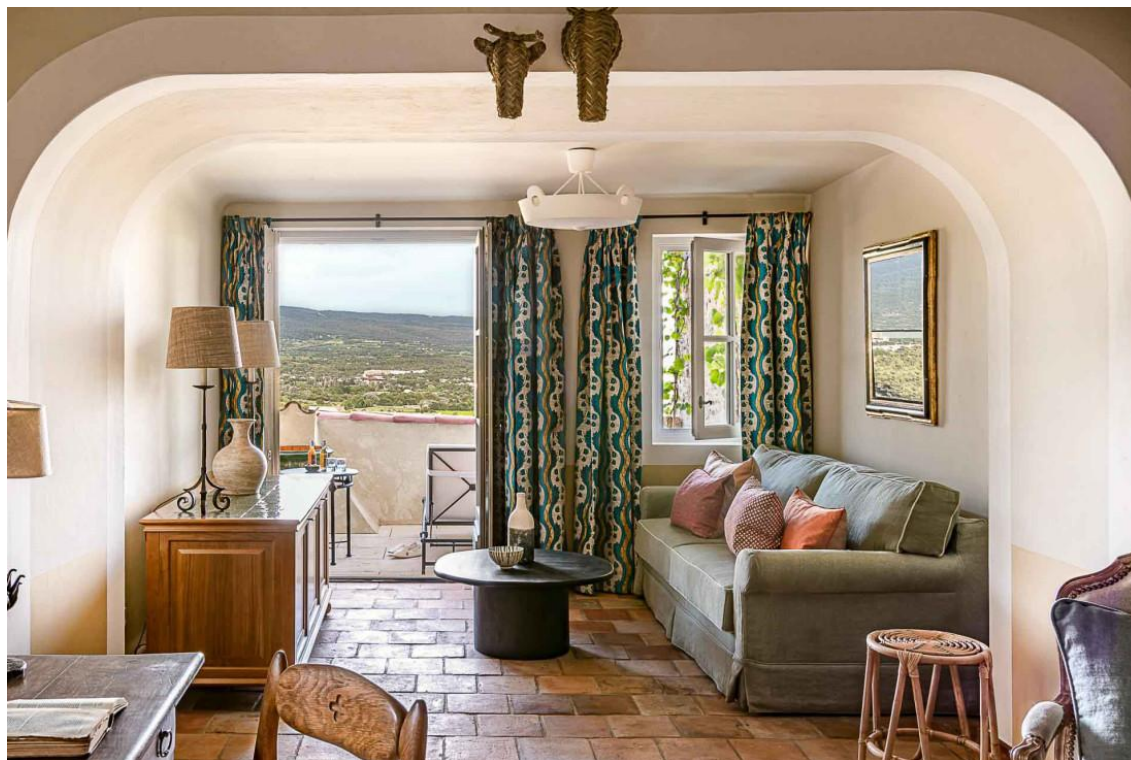
Hôtel Crillon le Brave