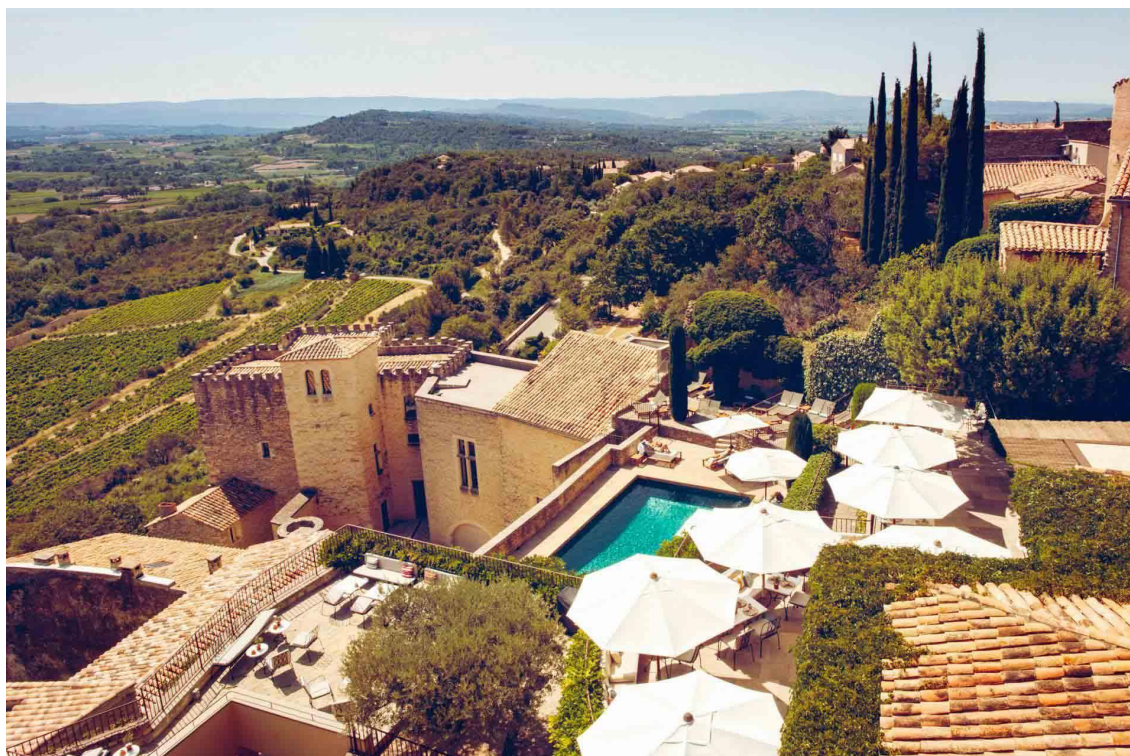
Hôtel Crillon le Brave

Pour un séjour sport et bien-être ? À la tranquille piscine extérieure s'ajoute, caché sous des voûtes ancestrales, le Spa des Ecuries. Avec ses 3 cabines de soins dont une double et des massages bios siglés Tata Harper, le lieu offre une atmosphère intimiste et feutrée. C'est l'ancienne chapelle qui héberge une lumineuse salle de fitness bien équipée où un coach peut concevoir un programme personnalisé. Et si l'envie vous prend de vous promener, des vélos sont disponibles pour arpenter la nature (on peut aussi facilement programmer l'ascension du Mont Ventoux depuis Crillon le Brave). Deux courts de tennis dans le village, 4 parcours de golf à moins de 30 minutes : les hyperactifs ont de quoi s'occuper !