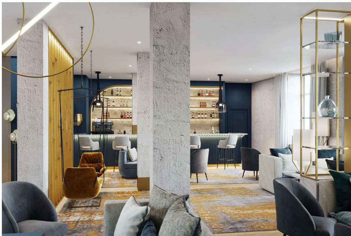
Fleur de Loire