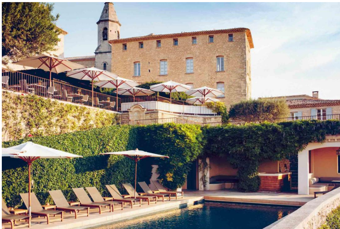
Hôtel Crillon le Brave