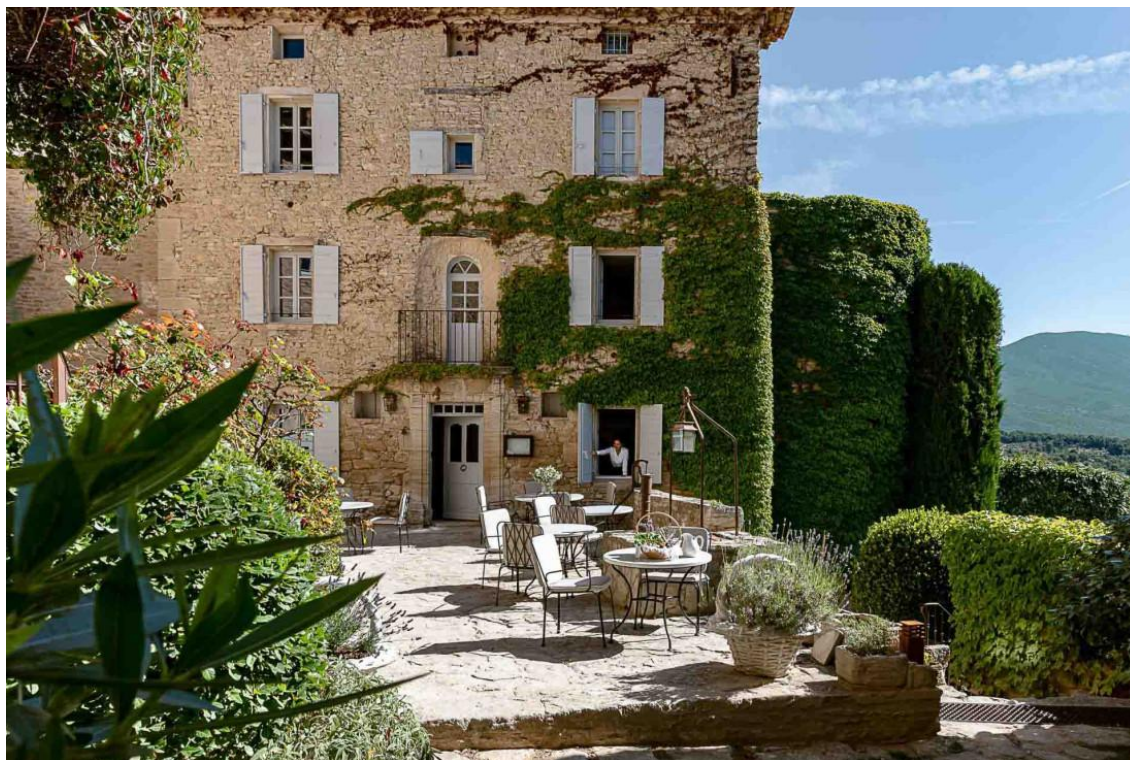
Hôtel Crillon le Brave